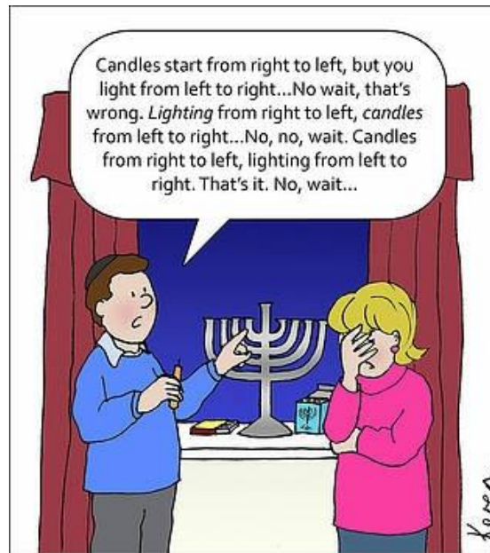
The Annual Chanukah Dilemma

להשכרה. דירת 5 חדרים במילר 19 א דירת 130 מטר נטו, 5 חדרים קומה 3 ע"ע מתוך 8 קומות. בעלת 2 מרפסות, שלשה כיווני אויר, מעלית, חנייה צמודה, משופצת מן היסוד כולל ריצוף אינסטלציה וחשמל, דלתות חדשות, בדירה 6 מזגנים חדשים. מקלחת ושירותים משופצים. שירותים כפולים חדשים. מטבח חדש. תאורה מעוצבת בכל הדירה. סביבה איכותית בקרבת מכוני וייצמן, ישיבת הדרום, תחכמוני, תיכון דה שליט מתנ"ס חיות, בתי כנסת. ניתן להשכרה לטווח ארוך. תעריף 6800 שקל לחודש. אלי 052-811-8614.